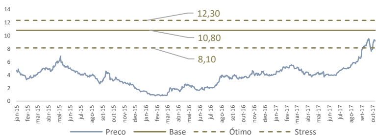
Gráfico 1. Histórico de Preço e Possíveis Cenários